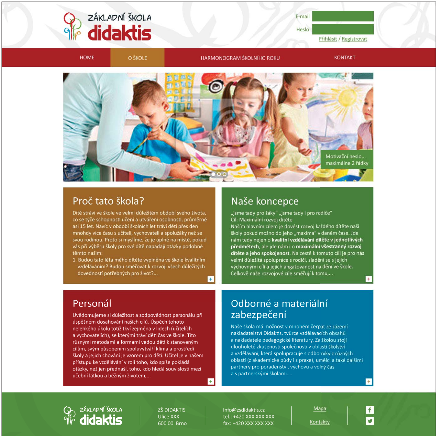
Obrázek č.2 zobrazuje situaci, kdy všechny obdélníky v těle dokumentu jsou zvolené – je to pro ukázkou změn jednotlivých barev (reálně je možné zvolit vždy jen jeden obdélník).