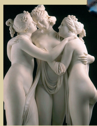
Antonio Canova: Tři Grácie

Klasicismus v hudbě směřoval k zesvětštění a zdemokratizování, přehlednosti a ucelenosti díla. Novým požadavkem se stala symetrie skladby a princip periodicity , podle kterého se hudební doprovod členil na pravidelné úseky. Rozvíjely se instrumentální formy (sonáta), ustálilo se složení orchestru (jádro představují smyčce). Oblíbeným nástrojem byl klavír. K skladatelům patřili Joseph Haydn, Wolfgang Amadeus Mozart nebo Ludwig van Beethoven . Představitelem tzv. citového slohu v hudbě (paralela k literárnímu hnutí Sturm und Drang) byl Carl Philip Emmanuel Bach (syn Johanna Sebastiana Bacha).