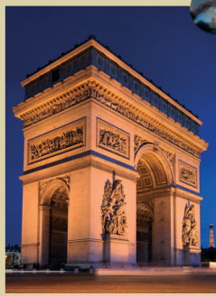
Vítězný oblouk v Paříži

V architektuře byl vyžadován přesný řád a pevná pravidla , která vycházela z antiky. Stavěly se zejména světské stavby (divadla, nemocnice, budovy úřadů a bank). Pro ty byla typická jednoduchá výzdoba, rovné čisté linie, trojúhelníkové štíty a antické sloupy . Oblíbené byly medailony a vavřínové věnce . Typické však byly i francouzské parky, založené na principech symetrie , plné altánů, alejí, vodotrysků a stromů sestříhaných do geometrických tvarů. Ke skvostům klasicistní architektury patří např. Pantheon a Vítězný oblouk v Paříži, Versailles , Národní galerie a Britské muzeum v Londýně, v Berlíně Braniborská brána a celé historické jádro Petrohradu .