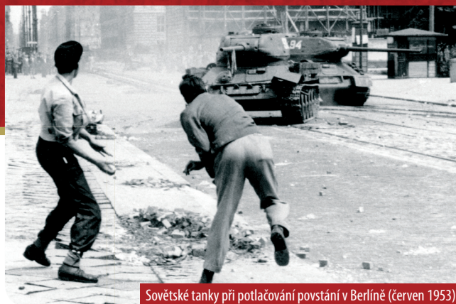
Sovětské tanky při potlačování povstání v Berlíně (červen 1953)