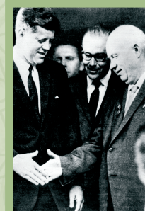
Kennedy (vlevo) a Chruščov (Viedeň, 1961)

Chruščovova riskantní rozhodnutí a jeho nevyzpytatelnost ovlivňovaly politiku a zahraniční vztahy SSSR. Na podzim 1957 odvolal z postu ministra obrany maršála Georgije K. Žukova, hrdinu druhé světové války a svého přítele, a to na základě nepodložených obvinění (snižování role strany v armádě aj.). Zbavil se tak jednoho z mála loajálních spolupracovníků a oslabil svou pozici ve vedení strany. Nebezpečné důsledky měly Chruščovovy kroky vedoucí ke karibské krizi. Chruščov i přes varování spolustraníka a přítele Anastase I. Mikojana usoudil, že Američané v čele s politicky nezkušeným prezidentem Kennedym proti raketám na Kubě nezasáhnou. Paradoxně tak v době uvolnění mezinárodních vztahů dovedl svět na pokraj jaderného konfliktu.